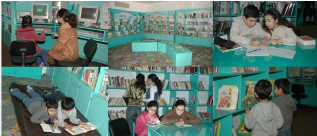
Visit to the Aley Library

The city of Aley, which means "the high place," is appropriately named given its location at almost 1,000 meters in Mount Lebanon. Inhabited primarily by Druze and Christians, Aley is also a popular tourist destination famous for its market and casino. The public library on National University Street, is managed by "Tajamoh' Chabbat Aley", a women's association in Aley. The bustling library is located in a large (400 square meters) and well-lit space. It is not surprising that most of the visitors to the library are children and adolescents since the library works closely with 10 primary and secondary schools in the city and surrounding areas. It offers support for students and sponsors a different activity every Friday afternoon: story hour, writing workshop; film screening; reading competitions, etc. Open on Wednesday, Thursday, and Friday afternoons and on Saturday morning, the library is equipped with four computers with internet access. Although it focuses on the needs of young people, the library also offers a number of services and activities for adults including conferences, book signings, and poetry evenings